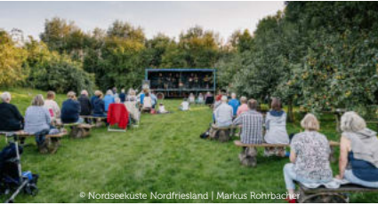
© Nordseeküste Nordfriesland | Markus Rohrbach