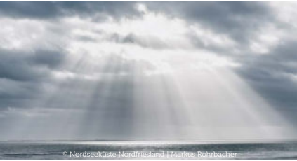
© Nordseeküste - Nordfriesland | Märkte Rührbäcker