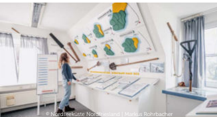
© Nordseeküste Nordfriesland | Markus Rohrbacher