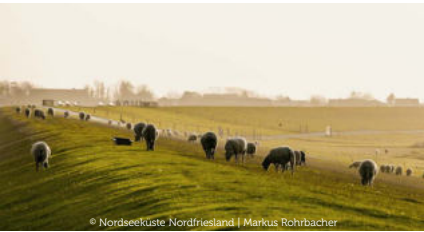
© Nordseeküste Nordfriesland | Markus Rohrbacher