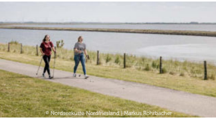
© Nordseeküste Nordfriesland | Markus Röhrbacher