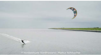
© Nordseeküste Nordfriesland | Markus Rohrbacher