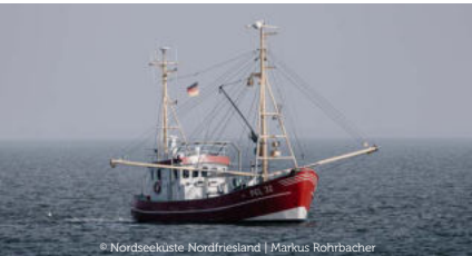
© Nordseeküste Nordfriesland | Markus Rohrbacher